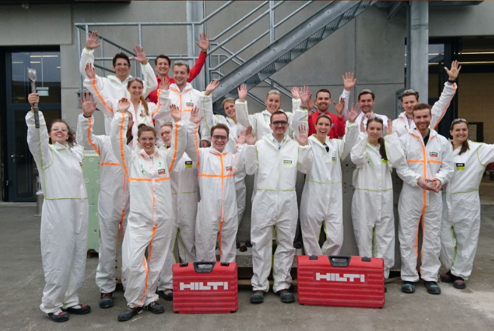
Werksbesichtigung und Produkt-Testing bei Hilti