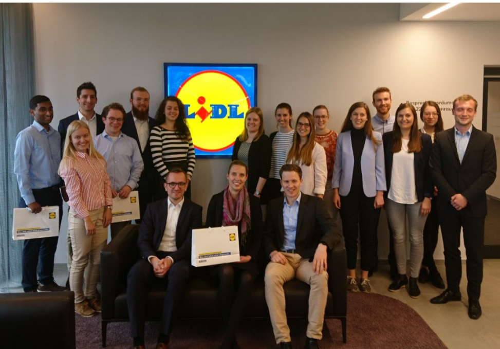
Zu Besuch bei LIDL