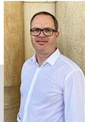
Prof. Dr. Hadwich Lehrstuhl für Dienstleistungsmanagement