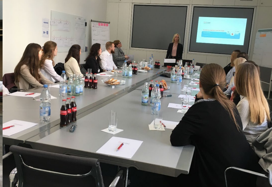
Zu Gast beim Deutschen Sparkassenverlag