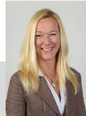
Prof. Dr. Büttgen Lehrstuhl für Unternehmensführung

Darüber hinaus wird der Marketing & Management Excellence Circle vom Förderverein für Marketing & Business Development e.V. an der Universität Hohenheim unterstützt.